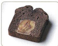
「くりあんケーキ ショコラ」

チョコレートを使った、冬期限定の栗菓子。栗あんをたっぷり練り込んだ生地地に、チョコレートを加えた焼菓子 2 種と、チョコレートムース、ババロア、栗あんを 3 層に重ねたババロアです。