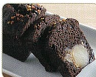
「栗かのごケーキ ショコラ」