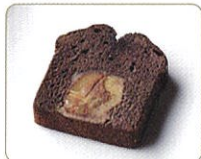
【くりあんケーキ ショコラ】

チョコレートを使った、冬限定の栗菓子。栗あんをたっぷり練り込んだ生地 に、チョコレートを加えた焼菓子 2 種と、チョコレートムース、ババロア、栗あんを 3 層に重ねたババロアです。