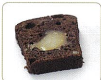
【栗かのかケーキ ショコラ】