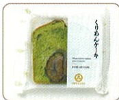
「くりあんケーキ抹茶」