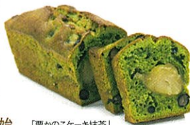
「栗かこのケーキ抹茶」