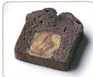
「くりあんケーキショコラ」

栗あんを練り込んだ生地、溶かしチョコレートと刻みチョコレートを加え、栗鹿ノ子を入れて焼き上げました。アクセントにピスタチオを添えました。