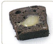
「栗かのごケーキショコラ」