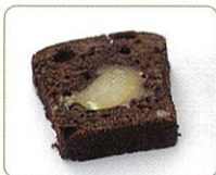
「栗かのかケーキ ショコラ」