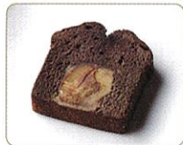
「くりあんケーキ ショコラ」

チョコレートを使った、冬期限定の栗菓子。栗あんをたっぷり練り込んだ生地、チョコレートを加えた焼菓子 2 種と、チョコレートムース、ババロア、栗あんを 3 層に重ねたババロアです。